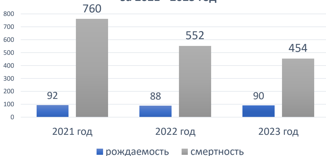
Сравнение рождаемости и смертности за 2021 - 2023 год